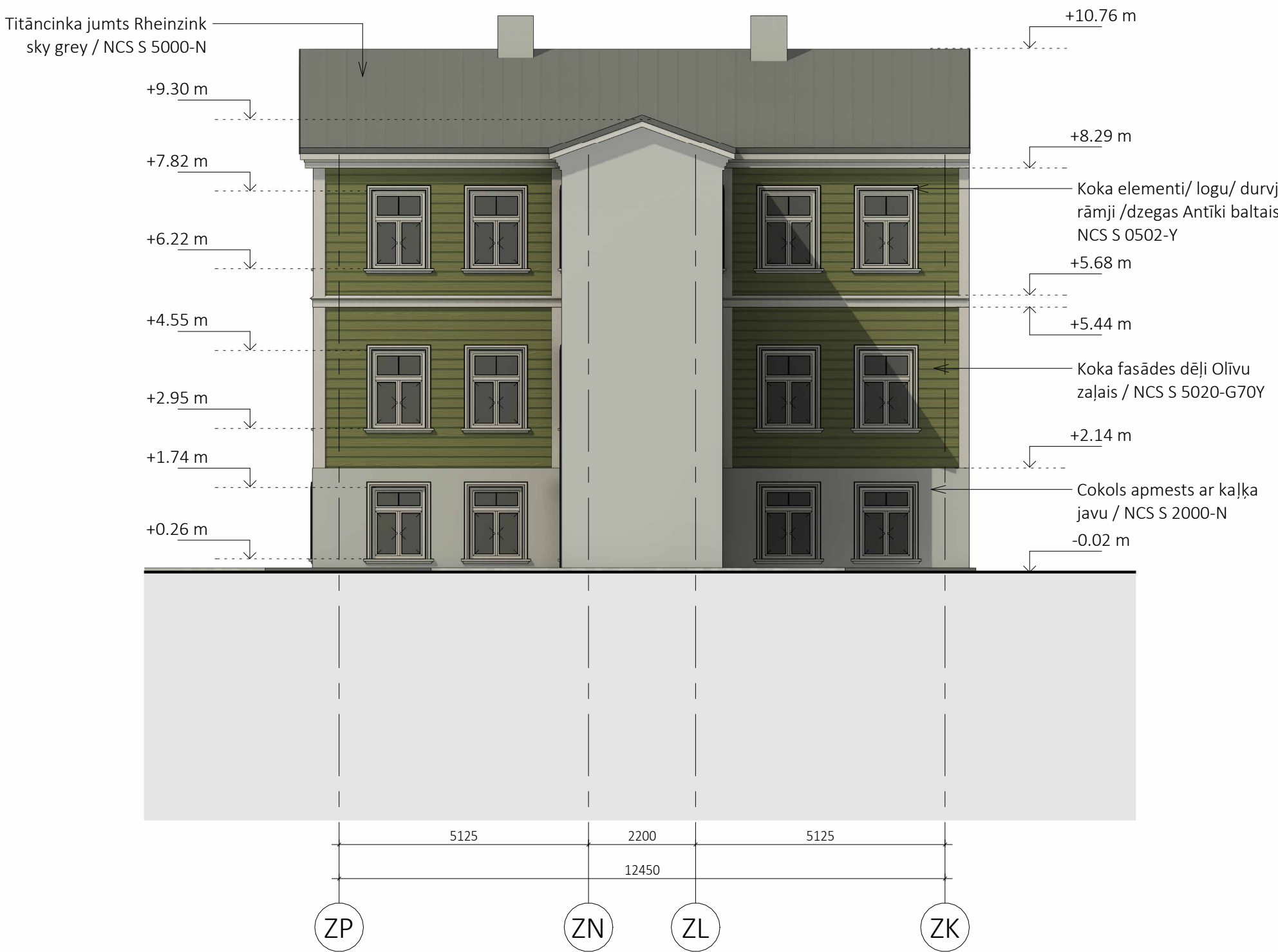
3. ZA fasāde