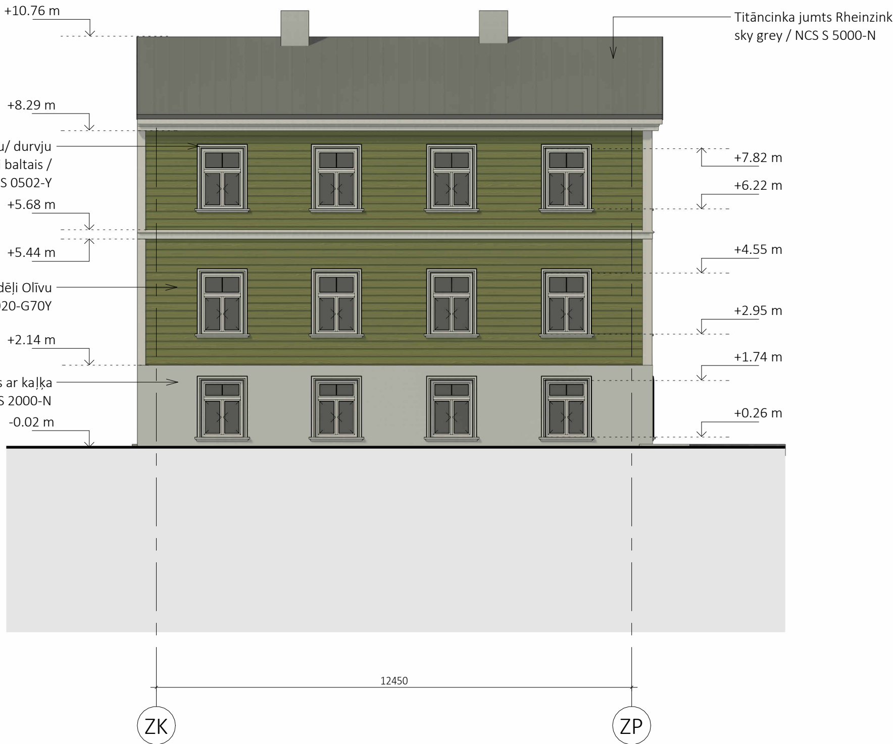
1. DR fasāde