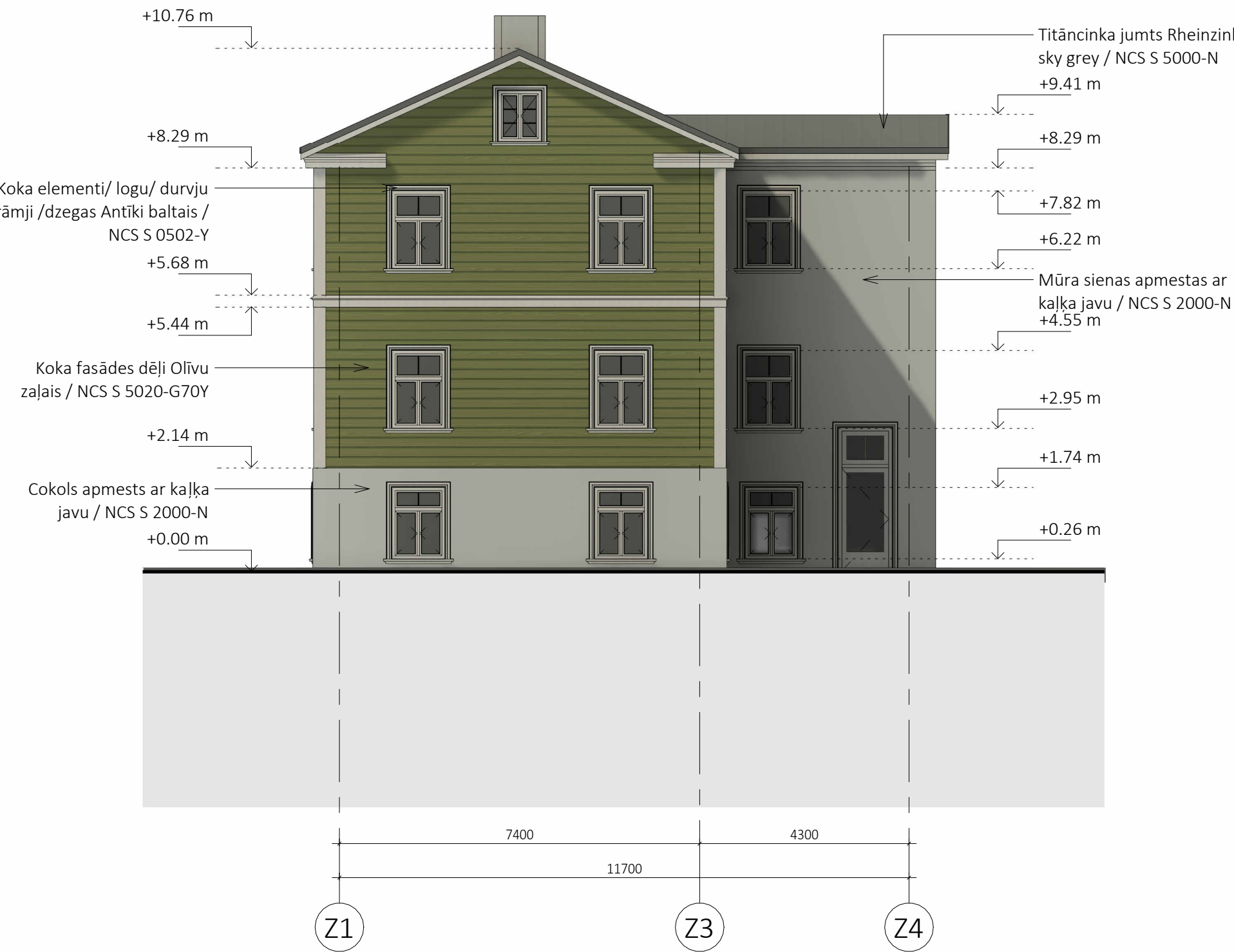
4. DA fasāde