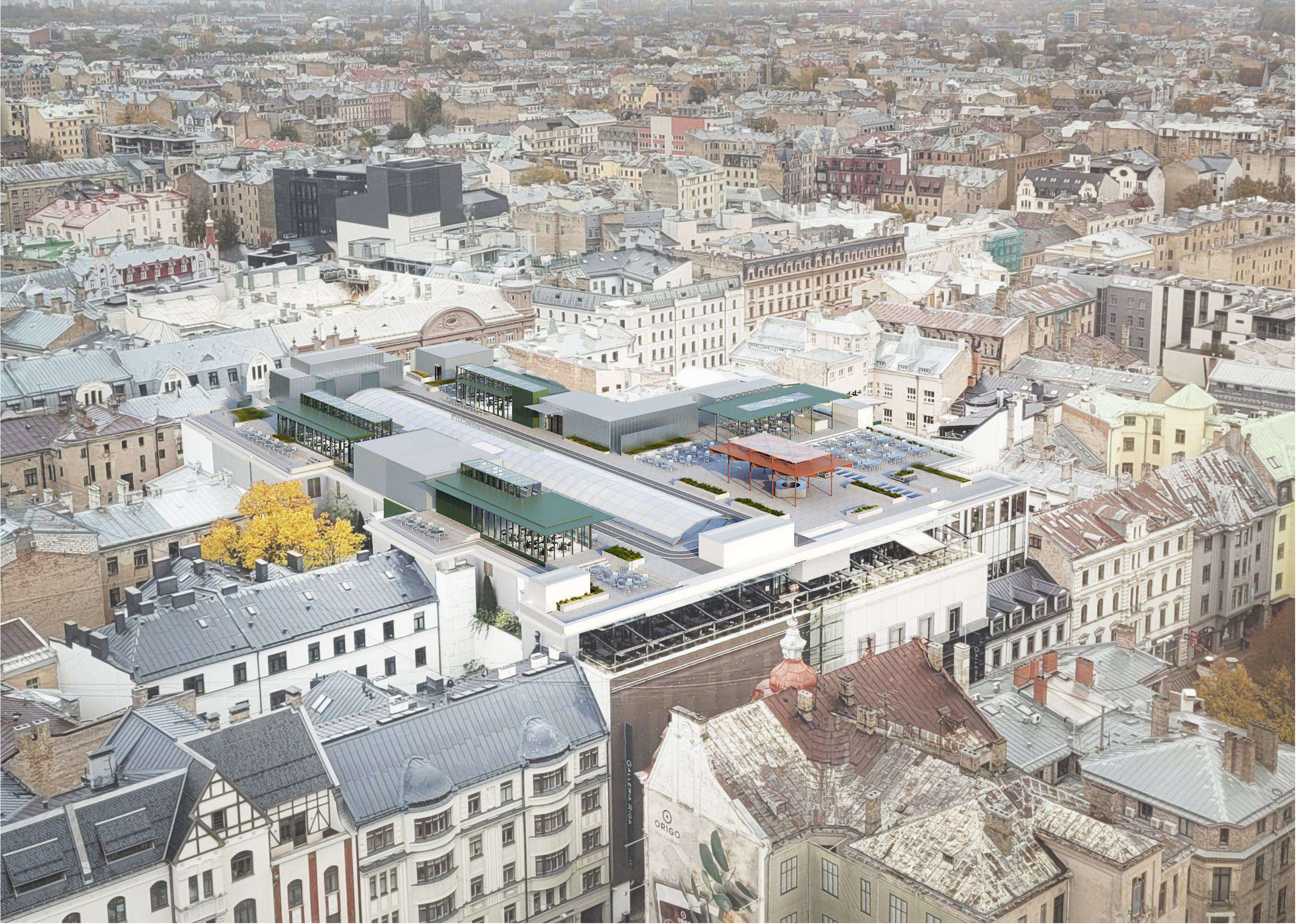
Vizualizācija apkārtesošās pilsētas kontekstā

Skats ar projektētajiem paviljoniem no viesnīcas "Radisson Blu Hotel Latvija" augšējā stāva atbilstoši MK 127. noteikumu punktam 3.1.4.11.