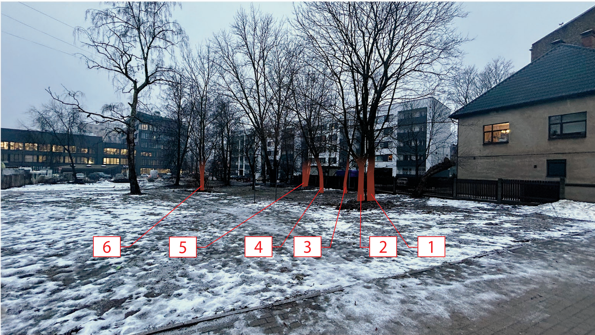
Cērtamo koku fotoīksācija, 25.01.2024.