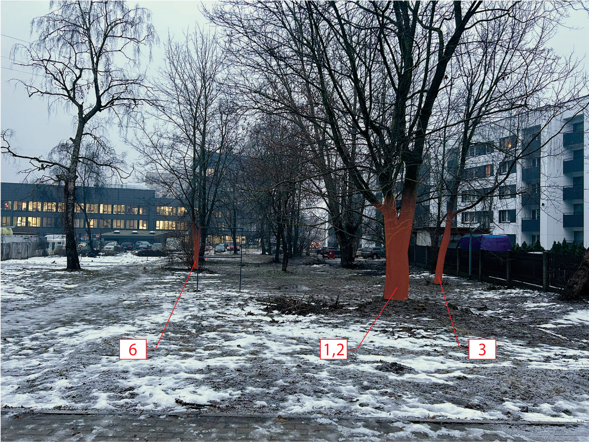
Cērtamo koku fotoīksācija, 25.01.2024.