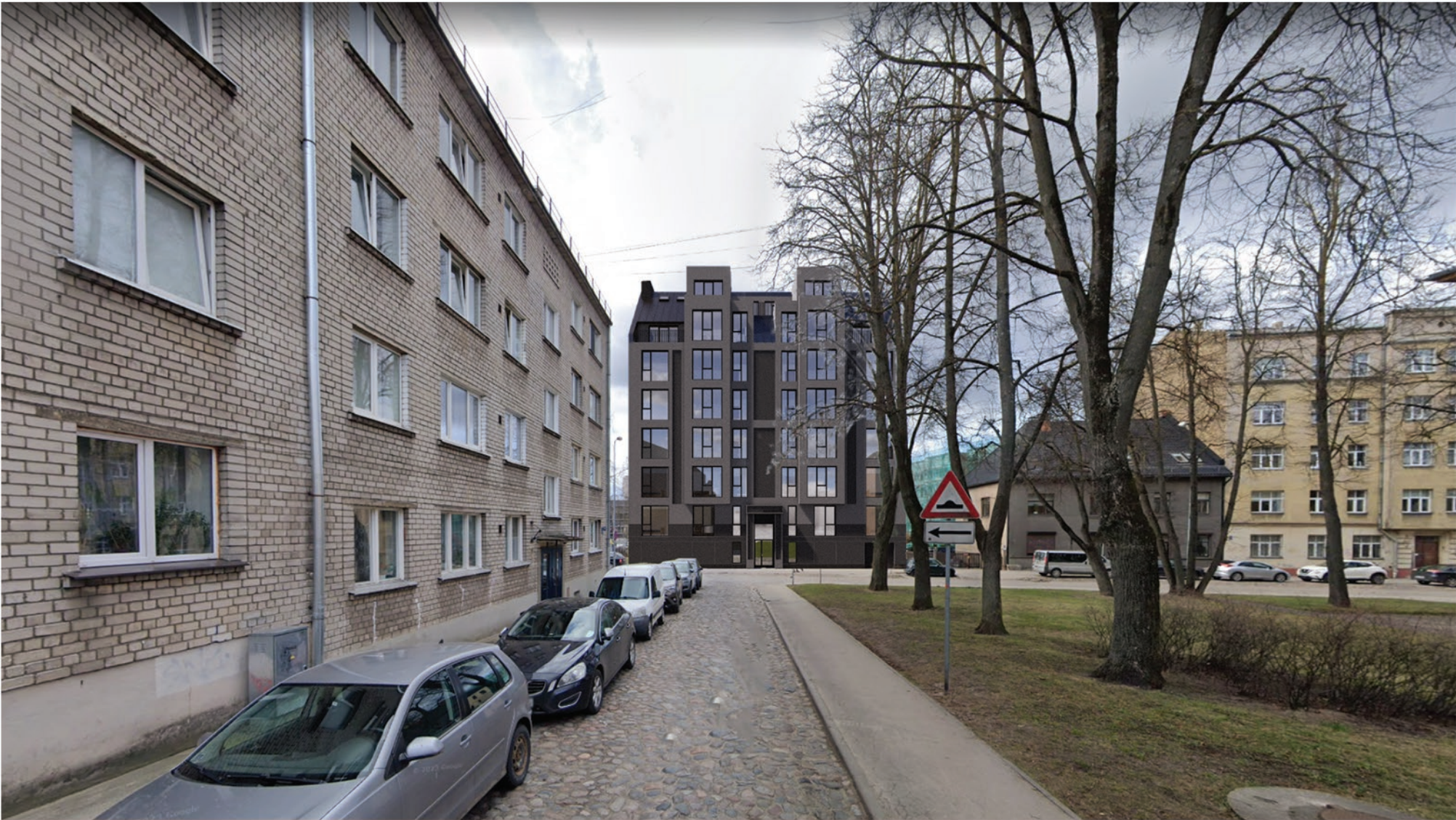
Plānotās ēkas vizualizācija, skats no leroču ielas