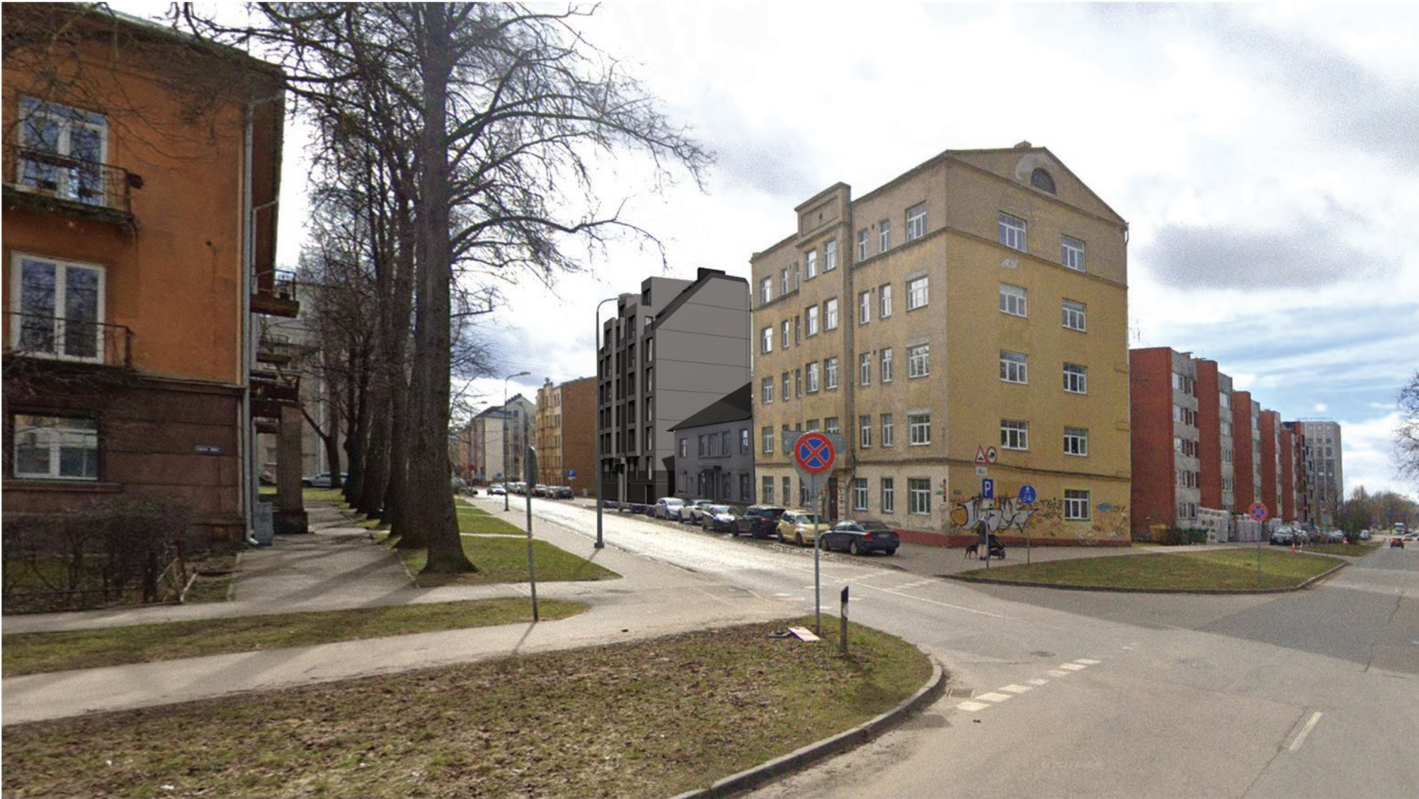
Plānotās ēkas vizualizācija, skats no Upes ielas