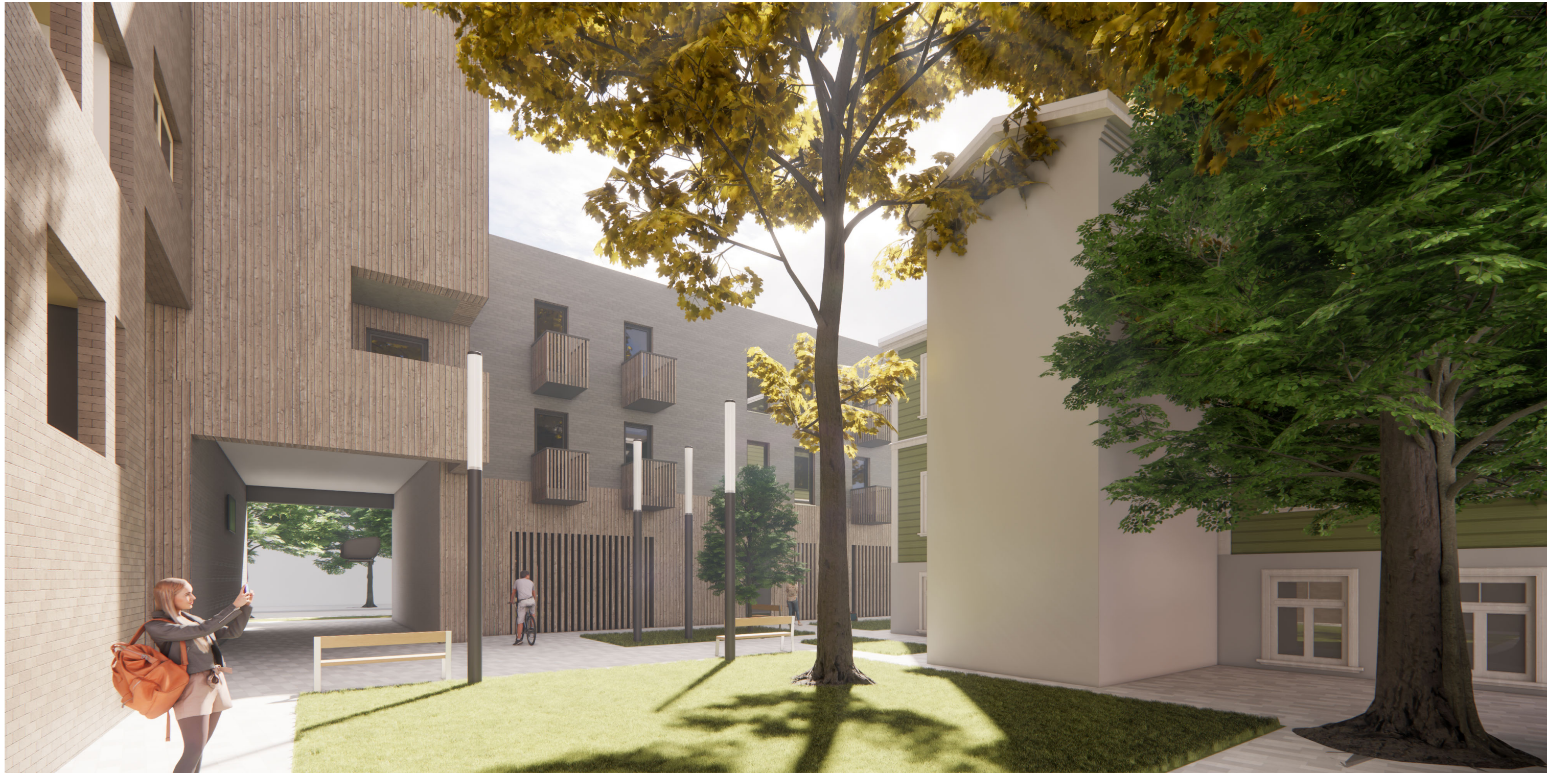
1. Projektēto ēku ZA, ZB, ZC-ZD skats no pagalma