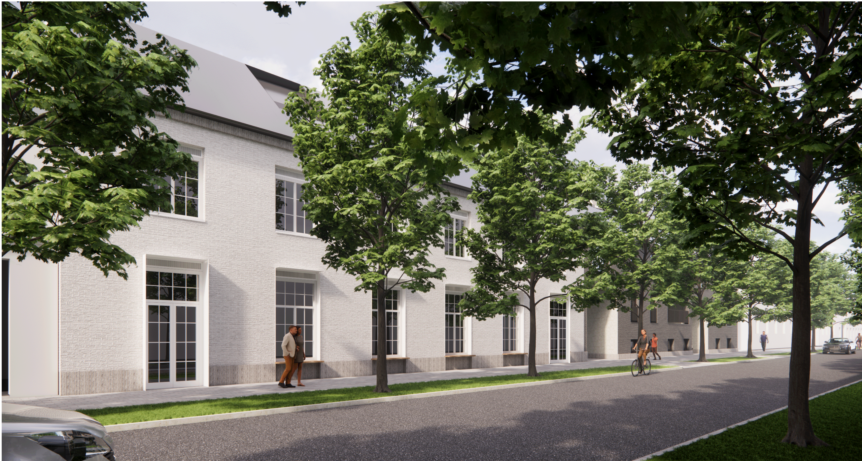
1. Projektēto ēku ZB, ZC-ZD un ZE skats no Zvaigžņu ielas