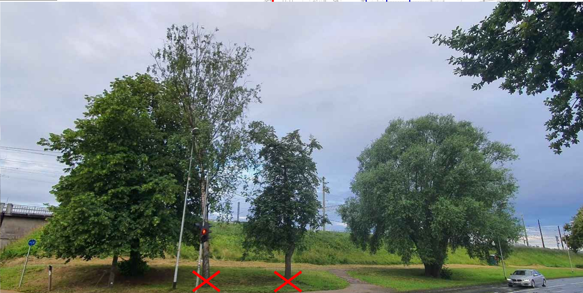
Koks Nr. 1