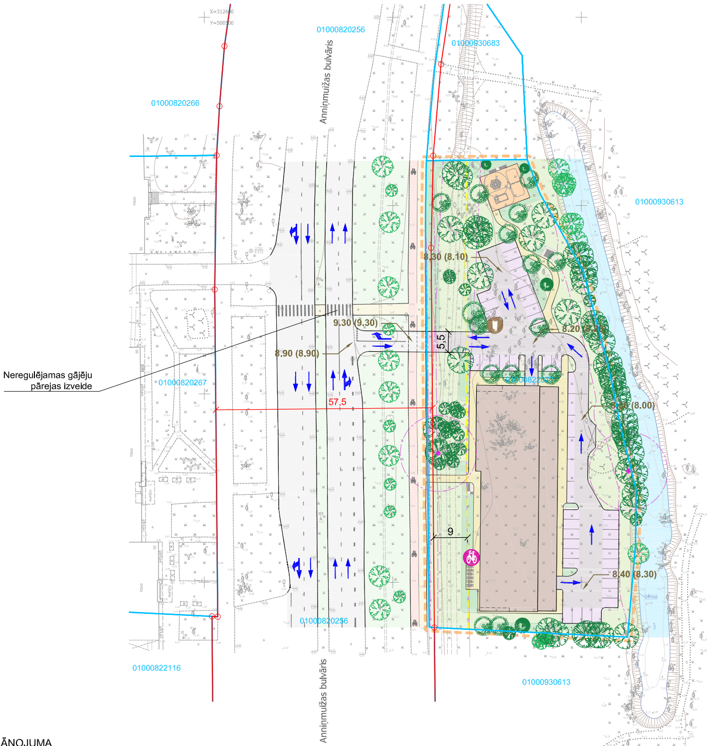
DETĀLPLĀNOJUMA TERITORIJAS IZVIETOJUMS