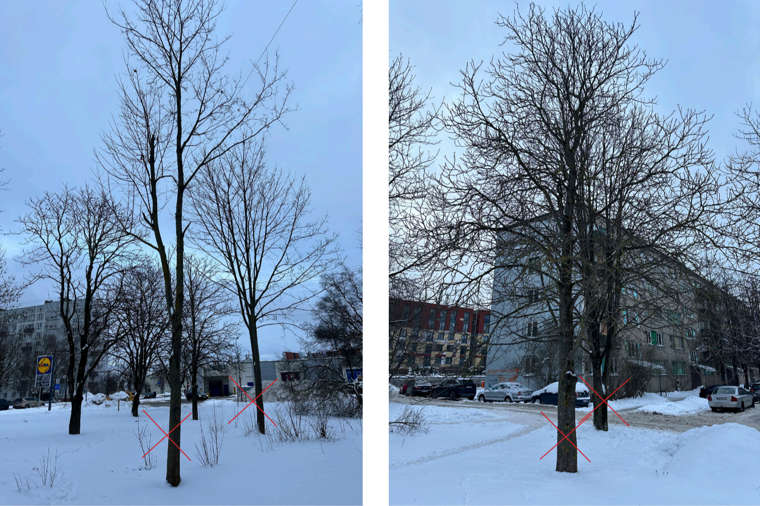
Attēls 1 Attēls 2