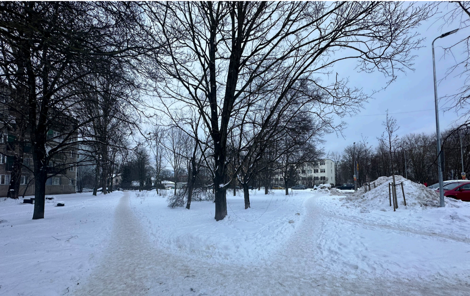
Skats no D robežas gājēju celiņa IZCĒRTAMO KOKAUGU FOTOFIKSĀCIJA