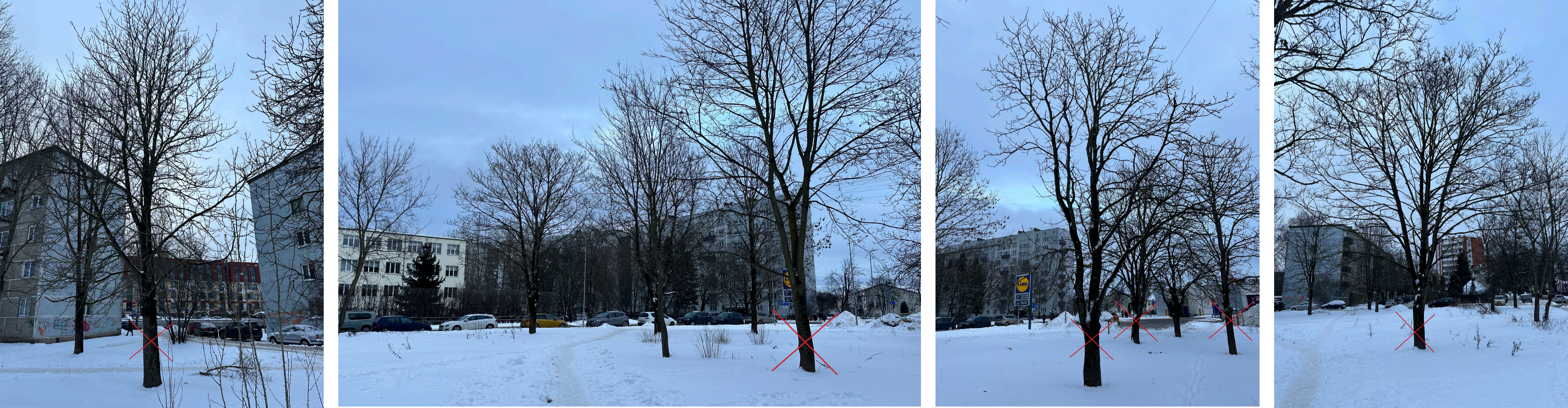
Attēls 3 Attēls 4 Attēls 5 Attēls 6