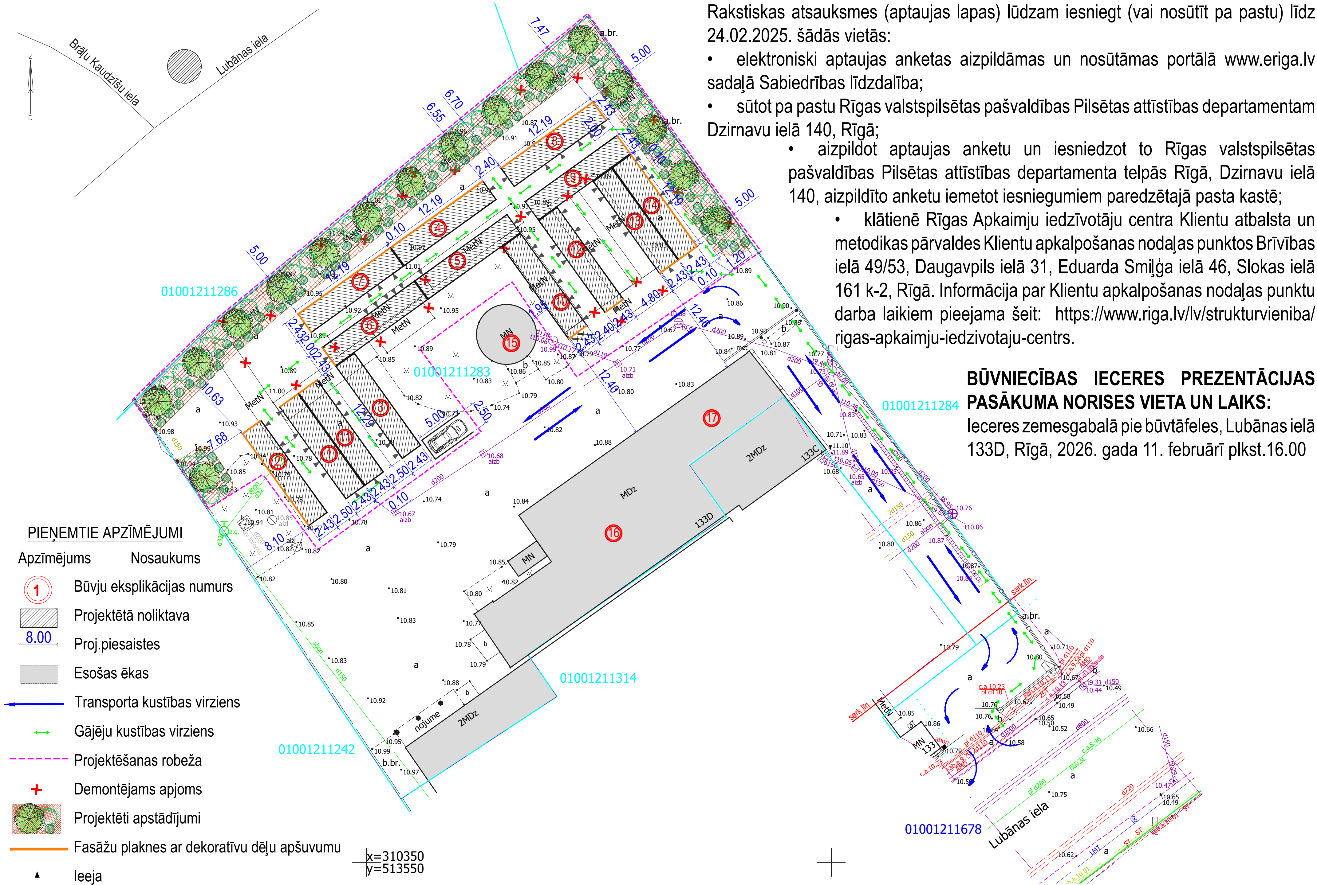
ĢENERĀLPLĀNS M 1:250

Publiskā apspriešana notiek no 28.01.2026. līdz 24.02.2026.