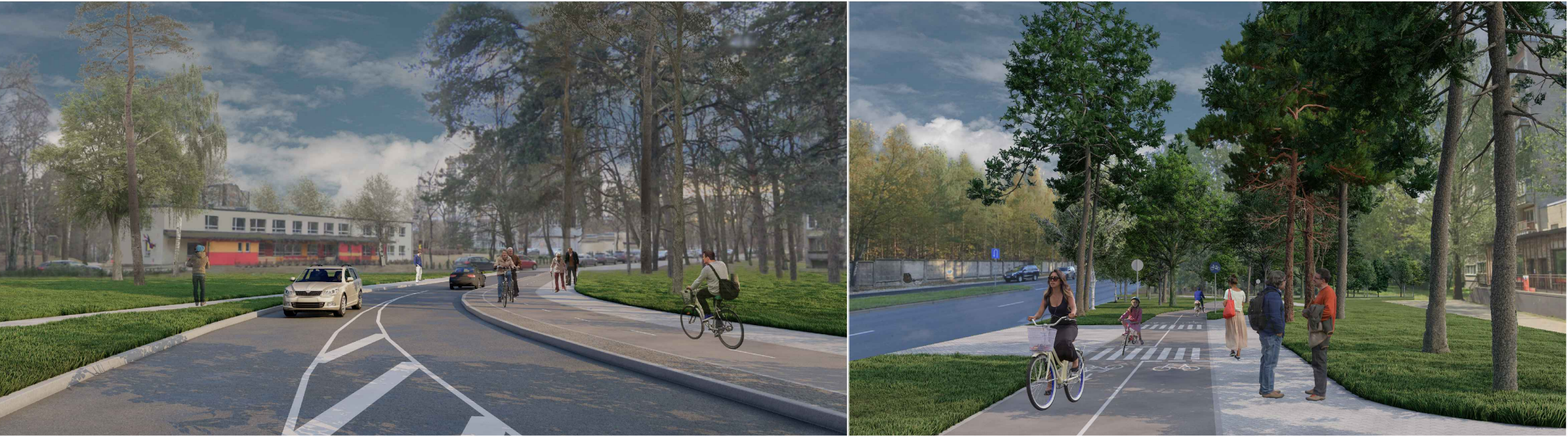
Viestura prospekts plānotais veloceliņš skats uz Rīgas 169. pirmsskolas izglītības iestādes filiāli